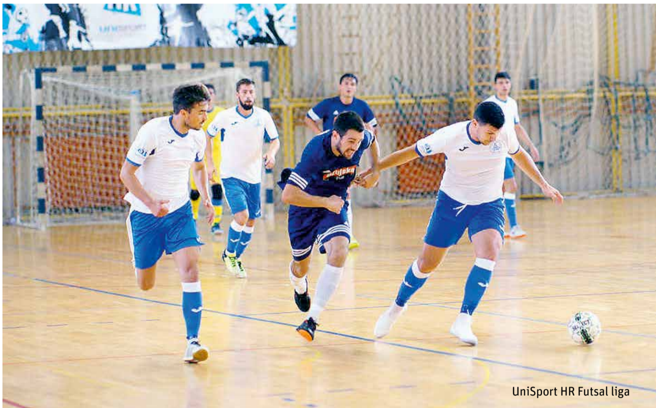
UniSport HR Futsal liga

Oba ova sportska događaja u Zagrebu imaju svoje premijerno izdanje na europskoj razini, a zagrebačko studentsko sportsko ljeto 2019., odvijat će se od 24. do 28. srpnja, kada se odvija prvenstvo u rukometu na pijesku te od 31. srpnja do 4. kolovoza, kada se događaju prvenstva u borilačkim sportovima.