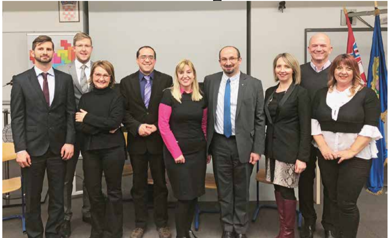
Dani Andrije Štampara