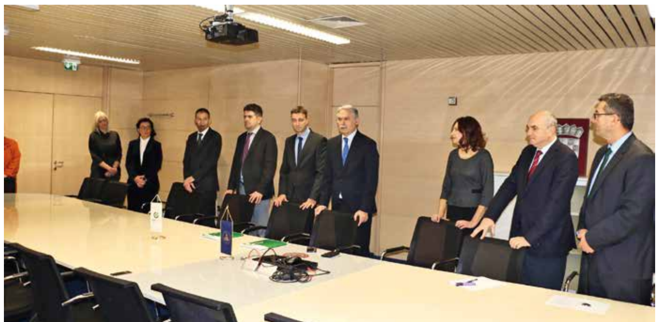
Uprave Sveučilišta u Splitu i OTP banke na primopredaji donacije

Predsjednik Uprave OTP banke Balazs Bekeffy također je izrazio zadovoljstvo odličnom suradnjom sa Sveučilištem i lokalnom zajednicom, kazavši kako je potpisivanje ovog ugovora još jedan korak dalje.