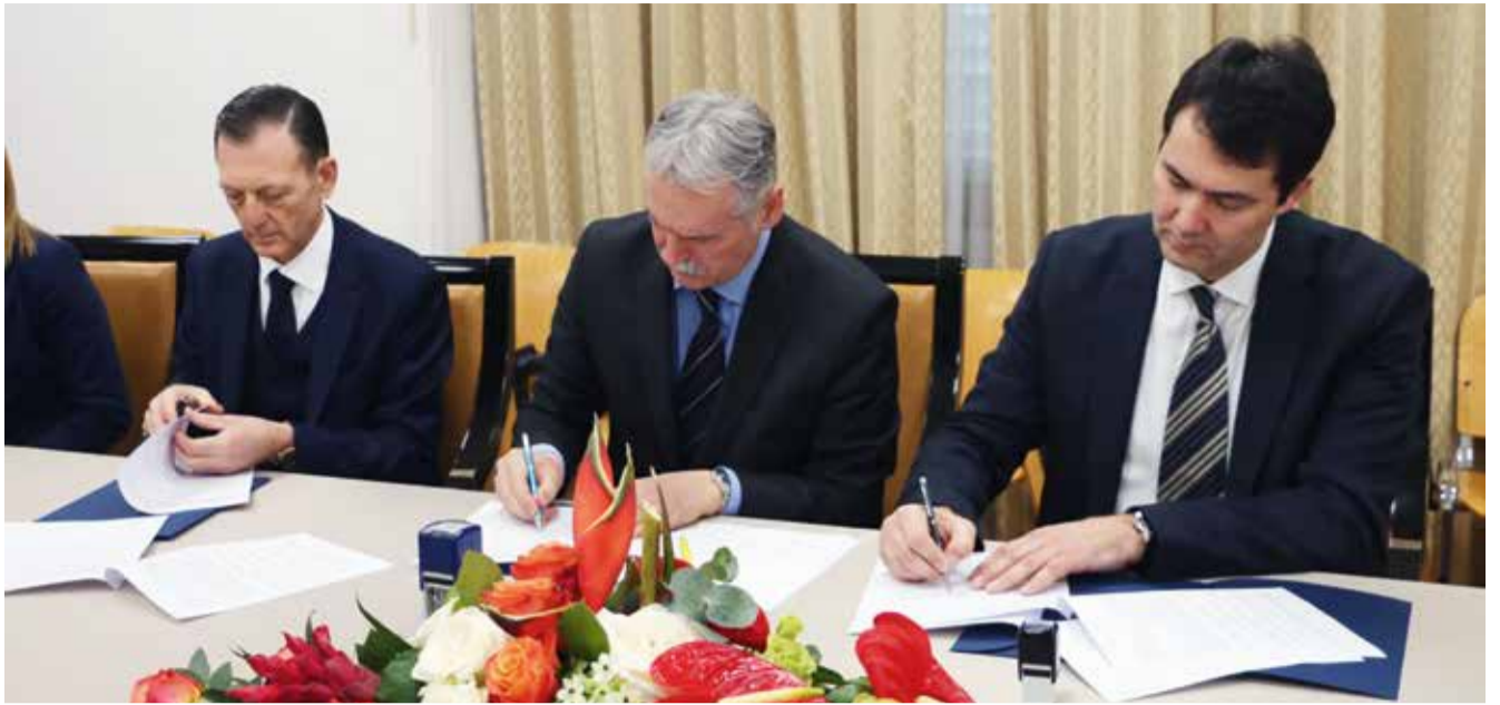
Potpisivanje Memoranduma o znanstveno-istraživačkoj suradnji između KBC-a Split i Medicinskog fakulteta u Splitu