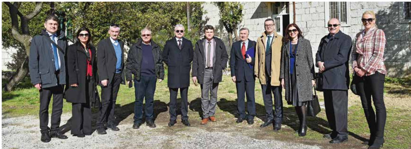
Sudionici dogovora o osnivanju fakulteta u Makarskoj ispred buduće fakultetske zgrade

Razgovori u tom smjeru, kako doznajemo, već su započeli, a na cijeloj Rivijeri svi s oduševljenjem očekuju početak rada novog dislociranog studija Sveučilišta u Splitu.