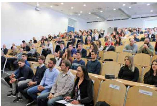
Na Danu FGAG-a nagrađeni su profesori i studenti

kazao je rektor Ljutić poručivši studentima da se obrazuju, uče i rastu jer su oni naš zalog za bolju budućnost.