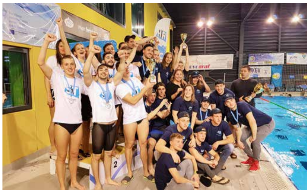
Svi osvajači plivačkih medalja

Inače, natjecanja su se odvijala u disciplinama prsno (50m, 100m), leđno (50m, 100m), leptir (50m, 100m), slobodno (50m, 100m, štafeta 4x50m) te mješovito (štafeta 4x50m), a sudjelovale su reprezentacije sveučilišta iz Splita, Zadra, Osijeka i Zagreba, Sve-