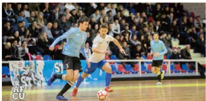
Za studente je ulaz besplatan na sve domaće utakmice

Osim što su na sredini prvoligaške tablice, ono što jedan klub kao što je AFCU uopće svrstava u vijest jest njegov drukčiji pristup sportu, koji je – kako sami kažu – ‘bez rezultatskog imperativa te uz dugoročnu orijentiranost na izgradnju dualnih karijera, odnosno spoja sporta i obrazovanja’