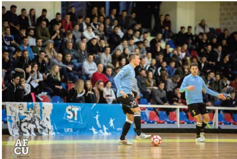
Posjećenost na tribinama domaćih utakmica AFCU-a redovito je velika

– Nakon božićno-novogodišnjeg odmora nastavljamo s treninzima i pripremama s