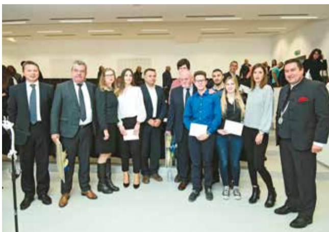
Nagrađeni studenti sa sponzorima nagrada i dekanom