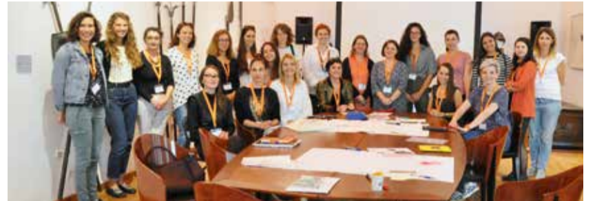
Sudionici teorijsko-praktičnih radionica

GOSTOVANJE BRITANSKIH MUZEJSKIH EDUKATORICA