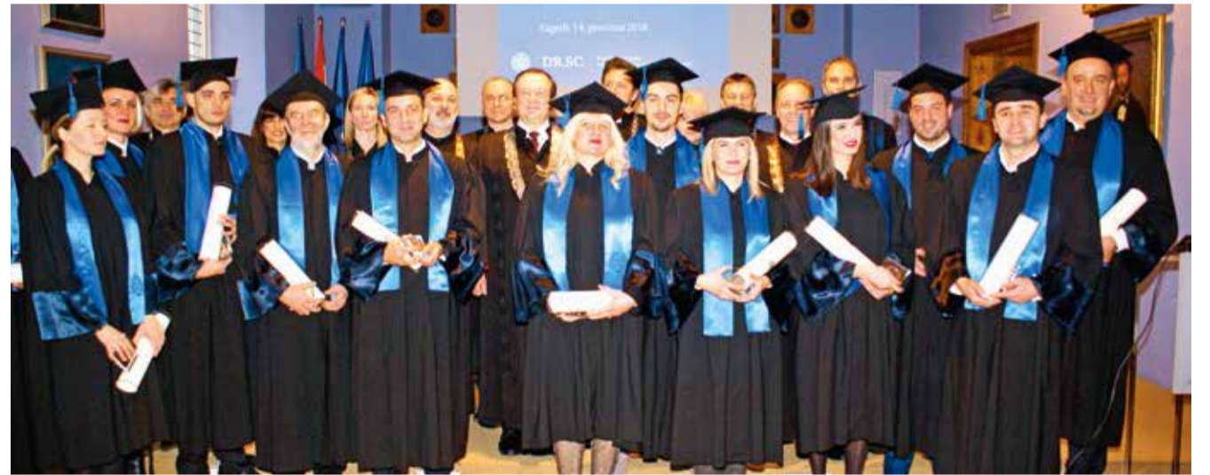
Promovirani novi doktori znanosti iz inozemstva