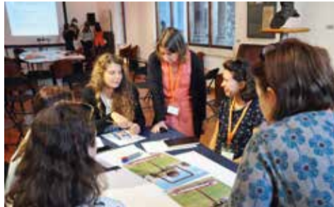
Jedna od radionica u Muzeju grada Splita