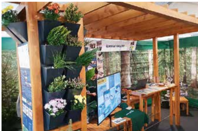
Štand Šumarskog fakulteta proglašen je najboljim na Smotri sveučilišta 2018.

Za najbolje uređen izložbeni prostor priznanje je dobio Šumarski fakultet Sveučilišta u Zagrebu. Priznanje za najbolje predstavljanje na pozornici dodijeljeno je Učiteljskom fakultetu Sveučilišta u Zagrebu, dok su priznanje za komunikativnost i susretljivost osvojili Medicinski fakultet i Geotehnički fakultet Sveučilišta u Zagrebu te Visoka škola Aspira iz Splita. Najoriginalnije predstavljanje na Smotri ostvarili su