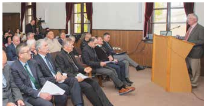
Otvorenje Centra don Frane Bulić na splitskom KBF-u

Svoju svrhu Centar postiže kroz nekoliko vrsta djelatnosti: individualni i grupni istraživački rad u domaćim i stranim arhivima, muzejima i knjižnicama; obrada i objava u izdavačkim nizovima epigrafskih i diplomatskih izvora nastalih u papirskoj kancelariji, te drugih izvora, osobito onih iz otomanske vladavine koji su od izuzetne važnosti za crkvenu povijest i teologiju južne Hrvatske; interdisciplinarni istraživački rad na srednjovjekovnoj rukopisnoj baštini (kodeksima) južne Hrvatske u domaćim i stranim arhivima i knjižnicama; objava tiskanih i elektroničkih izdanja Centra povijesne i teološke tematike, važnih za povijest Katoličke crkve u južnoj Hrvatskoj; snimanje dokumentarnih filmova povijesne i teološke tematike; organiziranje domaćih i međunarodnih seminara, ljetnih i zimskih škola te znanstvenih i stručnih skupova; suradnja s domaćim i međunarodnim visokoškolskim i istraživačkim institucijama i centrima, međunarodna razmjena istraživača, nastavnika i studenata te poticanje suradnje s gospodarstvenim sektorom.