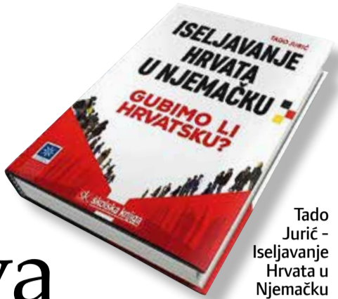
Tado Jurić - Iseljavanje Hrvata u Njemačku

Nemorala političkih elita, pravna nesigurnost, nepotizam i korupcija svakako su glavni razlozi iseljavanja, što je percepcija i samih iseljenika - istraživanje je obuhvatilo 1200 ispitanika u Njemačkoj - koji drže da u Hrvatskoj nisu institucionalizirane vrijednosti radne etike i poštenja, te smatraju da se hrvatsko društvo moralno slomilo