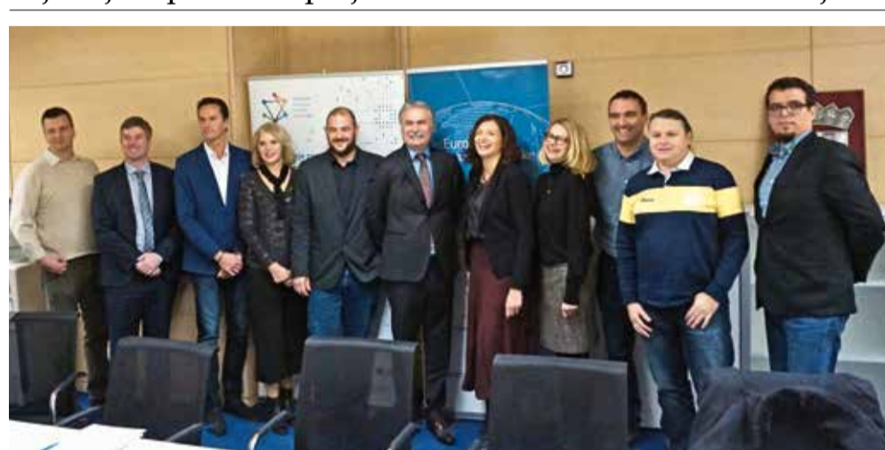
Čelnici Sveučilišta s predstavnicima tvrtki, korisnika poticaja

Program provjere inovativnog koncepta provodi se u okviru Hrvatskog projekta tehnološkog razvoja (eng. Croatia Science & Technology Project - STP II) u suradnji s Ministarstvom znanosti i obrazovanja Republike Hrvatske i Svjetskom bankom. Zadaća provedbe Programa dodijeljena je HAMAG-BICRO-u.