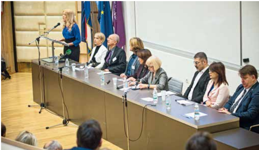
S otvaranja skupa o migracijama

ca u drugim državama. Znanstveno-stručnim pristupom, u komparativnoj perspektivi znanstvenika i stručnjaka u regiji, namjera je bila potaknuti raspravu o odnosu nacionalnog, europskog i globalnog kroz prošlu, sadašnju i buduću perspektivu. Jedan od važnih ciljeva konferencije bio je promišljati o hrvatskom identitetu dvadeset sedam godina nakon osnutka hrvatske države. Isto tako, željelo se proširiti istraživačka pitanja stavljajući u fokus identitet i demografski potencijal i perspektivu, migracije i ekonomiju, nacionalni identitet u globalizirajućem okruženju, identitet u odnosu na migracijsku i izbjegličku krizu, nacionalni identitet spram europskog identiteta i dr. U dijalogu s brojnim nacionalnim i međunarodnim suorganizatorima pokazalo se kako je moguć dijalog struke i znanosti, privatnog i državnog sektora. Progovorilo se o problemima, ali i ponudila odre-