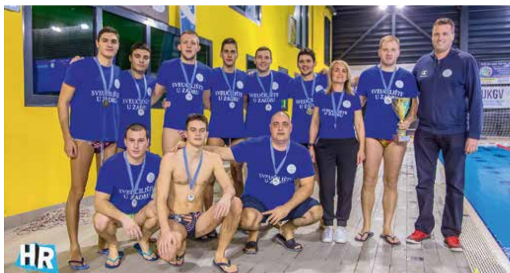
Vaterpolski prvaci sa Sveučilišta u Zadru