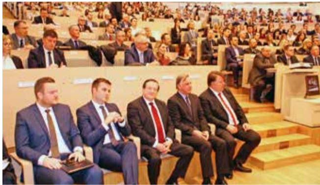
Proslava Dana Ekonomskog fakulteta