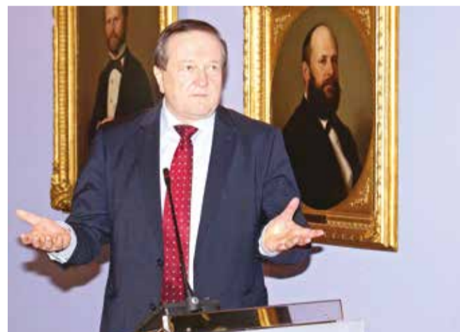
Rektor Damir Boras

postupka, a dodatno je ugašeno 20 doktorskih programa nakon što im je objavljeno da su uključeni u proces reakreditacije. Havranek je najavila da će se u novom reakreditacijskom ciklusu dati naglasak na praćenju ishoda učenja, reviziji ECTS bodova, praćenju omjera studenata i nastavnika te zapošljavanja diplomiranih studenata.