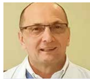
Miroslav Samaržija izabran je u znanstveno- nastavno zvanje redovitog profesora – trajno u području biomedicine i zdravstva, polje kliničke medicinske znanosti, grana interna medicina