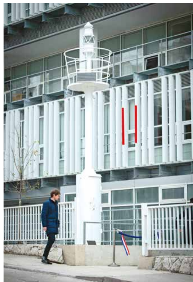
Lanterna Svjetlo Kampusa

Dan fakulteta je nastavljen dodjelom nagrada. Povelje fakulteta su dobili Jadroplov i Plovput za doprinos