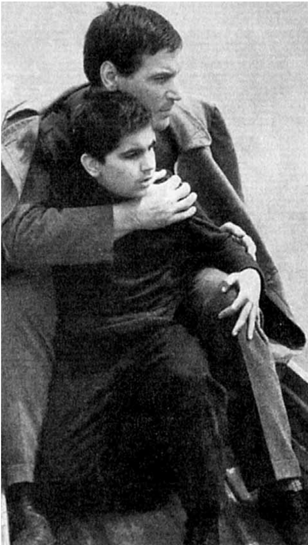
Bert Sotlar i Zlatko Lukman u filmu Ne okreći se sine (1956)

ro su se, sa sličnim dinamizmom javljanja i nestajanja kao i između dva svjetska rata, počela javljati specijalizirana popularizacijska periodika (npr. Filmska revija , 1950-1952), ali i časopisi sa studioznijim teorijskim i savjetodavnim pristupom (najdulje se održala Filmska kultura , koja je počela izlaziti 1957. u Zagrebu).