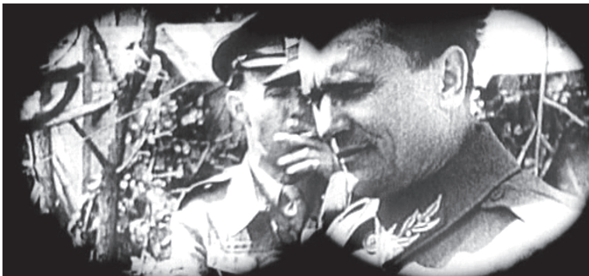
slika 3 ( Desant na Drvar )

Prije nego osporim te tvrdnje, neka mi bude dozvoljeno primijetiti da one prilično podsjećaju na neizbježnog Škrabala i njegove sudove o Bitki na Neretvi . Pavičićev deus absconditus mi izgleda kao neprijavljena parafraza Škrabalove tvrdnje da Tito kod Bulajića "djeluje kao nevidljivi, ali sveprisutni Svevišnji" (1998: 362), a Škrabalo primjećuje i da glavni likovi u filmu ne nose autentična imena iz povijesti, što bi se dalo iščitati kao brisanje autentičnih figura partizanske borbe (izuzev, naravno, Tita). Na Pavičićevu nesreću, sve to zbilja vrijedi za Bitku na Neretvi , ali nikako i za Sutjesku ili Desant na Drvar , odnosno ne smije se generalizirati kao konvencija cijelog žanra.