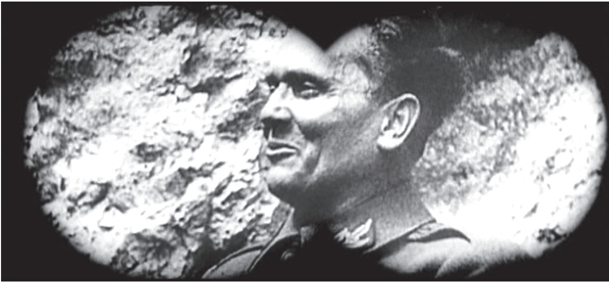
slika 2 ( Desant na Drvar )

koja je svojedobno bila označena jednom kolokvijalnom, posrpdnom etiketom, Pavičić reartikulira kao žanr, prišivajući joj superspektakularnu etiketu. Kako takvo krštenje mora pratiti analiza koja bi potvrdila da superpartizanski spektakli uistinu dijele dovoljno odlika koje bi mogle biti proglašene za žanrovske karakteristike, Pavičić u nastavku pobraja sedam odlika filmova "crvenog vala". No, način na koji te odlike definira i ilustrira, potpuno razotkriva njegovu metodološku dubioznost. Umjesto da ih izvede iz filmova koje je prethodno naveo kao primjere žanra, Pavičić žanrovske odlike prvenstveno ilustrira Desantom na Drvar , dakle filmom nastalim u vrijeme kad takvi filmovi "još nisu normativni" (13). Suspektnost Pavičićevog postupka i njegovih rezultata podcrtat ću testiranjem njegovih odlika navodnog žanra kako na Desantu na Drvar , tako i na partizanskim superspektaklima. Zbog ekonomije teksta, fokusirat ću se samo na one ključne odlike koje su po Pavičiću nedvojbeno ideološki uvjetovane, te čine žanr superpartizanskog spektakla režimskim instrumentom za populističku reafirmaciju ideoloških mitova titoizma.