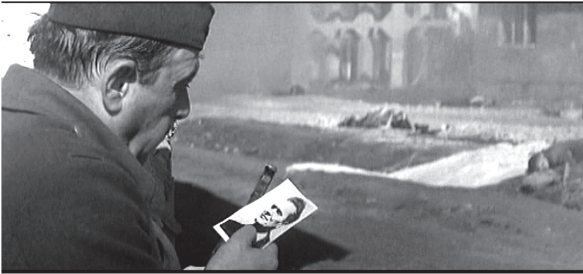
slika 6 (Desant na Drvar)

pedeset raznih organizacija, radnih organizacija koje su iz svojih ličnih dohodaka odvajale, iz pijeteta prema tim velikim temama. I to je sasvim u redu: mi moramo pozdraviti tu agilnost, takvo učešće naših radnih organizacija, i konačno: dragocjeno učešće – bez kojeg se uopće ne bi moglo – to je učešće Jugoslavenske armije, koja je u ljudstvu i u oružju i u ogromnoj dobroj volji pomogla da dođemo do takvih filmova.