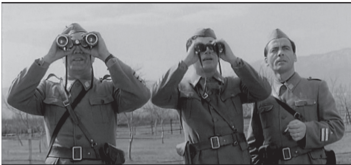
slika 1 (Desant na Drvar)